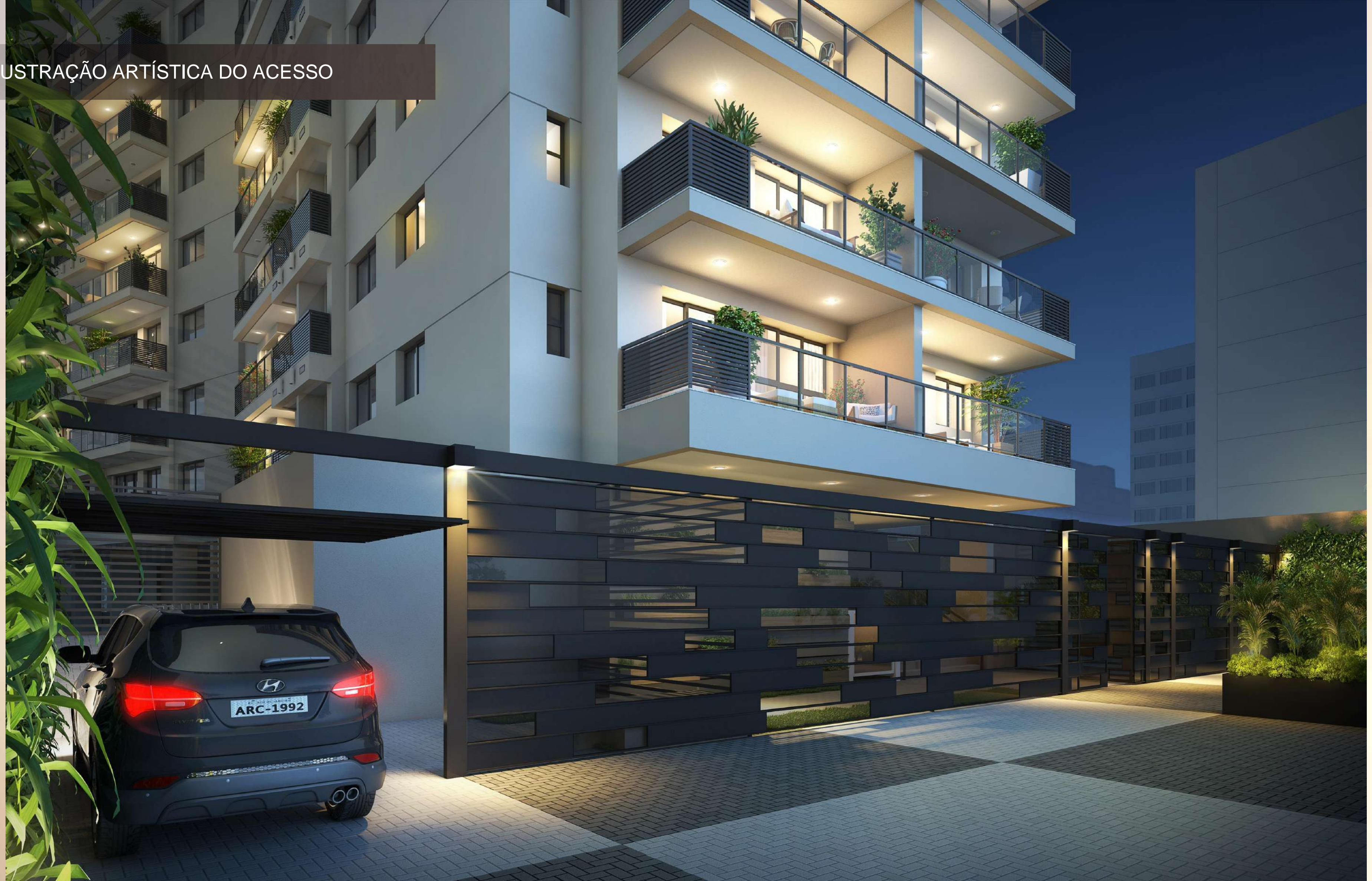
ILUSTRAÇÃO ARTÍSTICA DO ACESSO