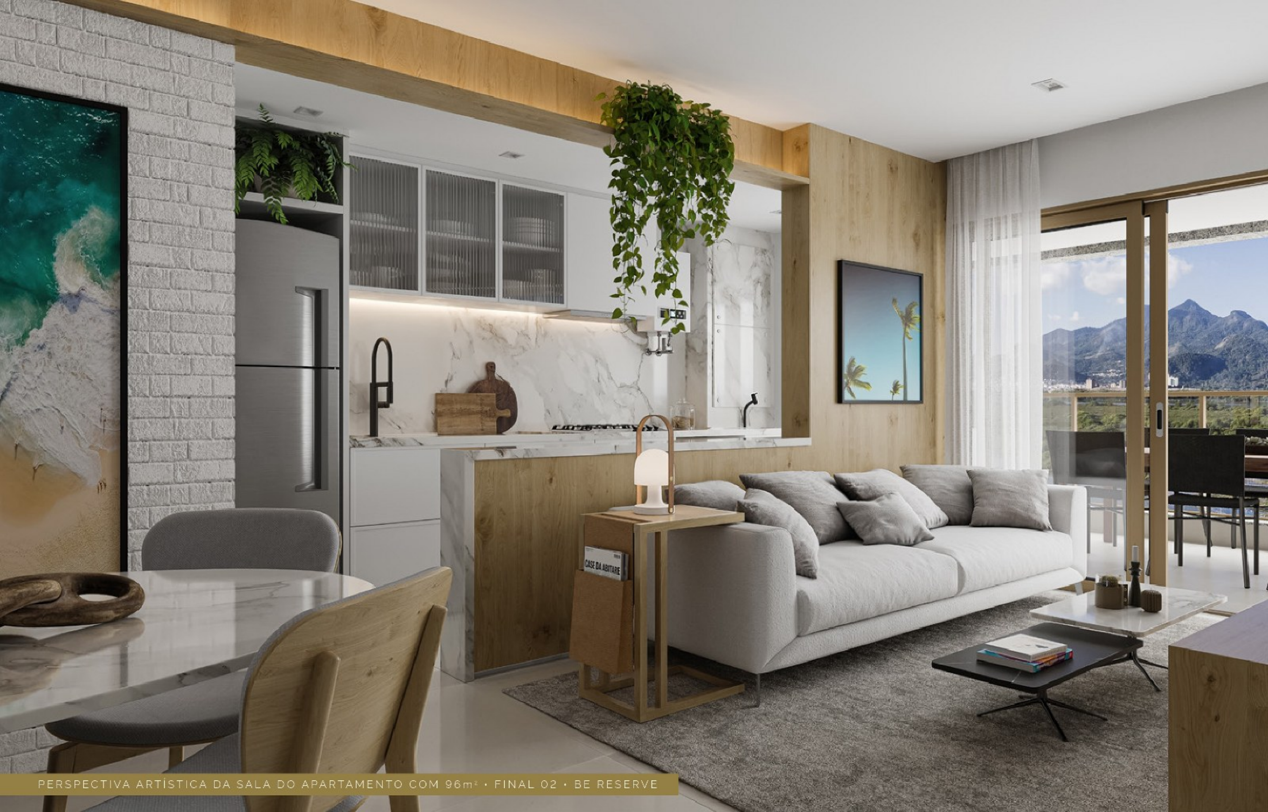
PERSPECTIVA ARTÍSTICADA SALA DO APARTAMENTO COM 96m 2 • FINAL 02 • BE RESERVE