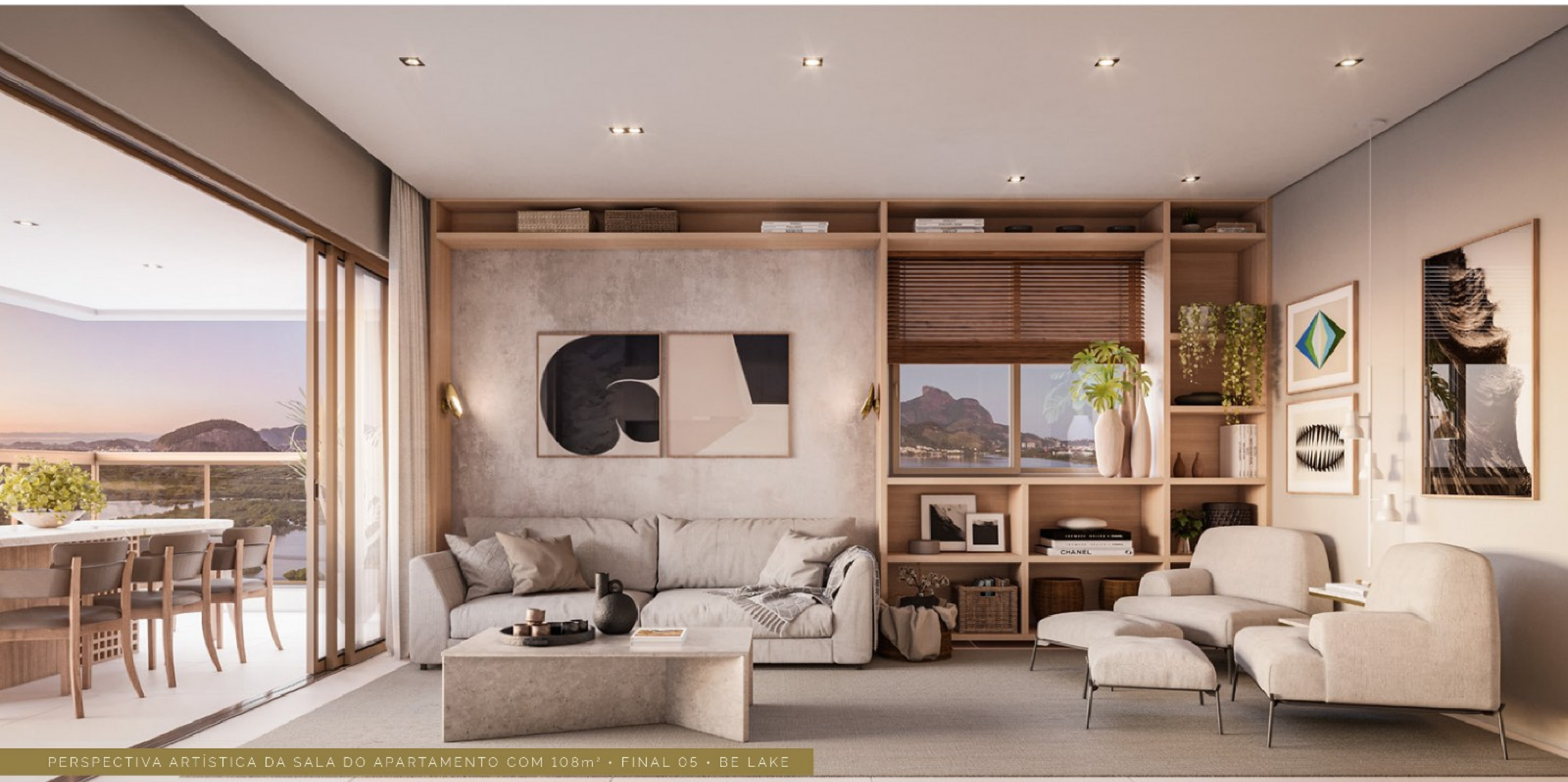
PERSPECTIVA ARTÍSTICA DA SALA DO APARTAMENTO COM 108m 2 • FINAL 05 • BE LAKE