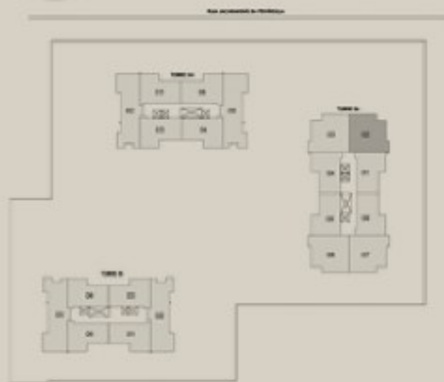
Ilustração anterior da planta com 95,82m 2 , final 02, Be Reserve. A sugestão de decoração, os móveis e utensílios são de dimensões comerciais e não fazem parte do contrato de compra e venda. Os revestimentos, bancadas, louças, metais e piso representados nas áreas do apartamento são uma sugestão de decoração e serão entregues conforme Memorial Descritivo do empreendimento. Medidas de eixo a eixo. Todos os itens serão entregues conforme Memorial Descritivo dos apartamentos.