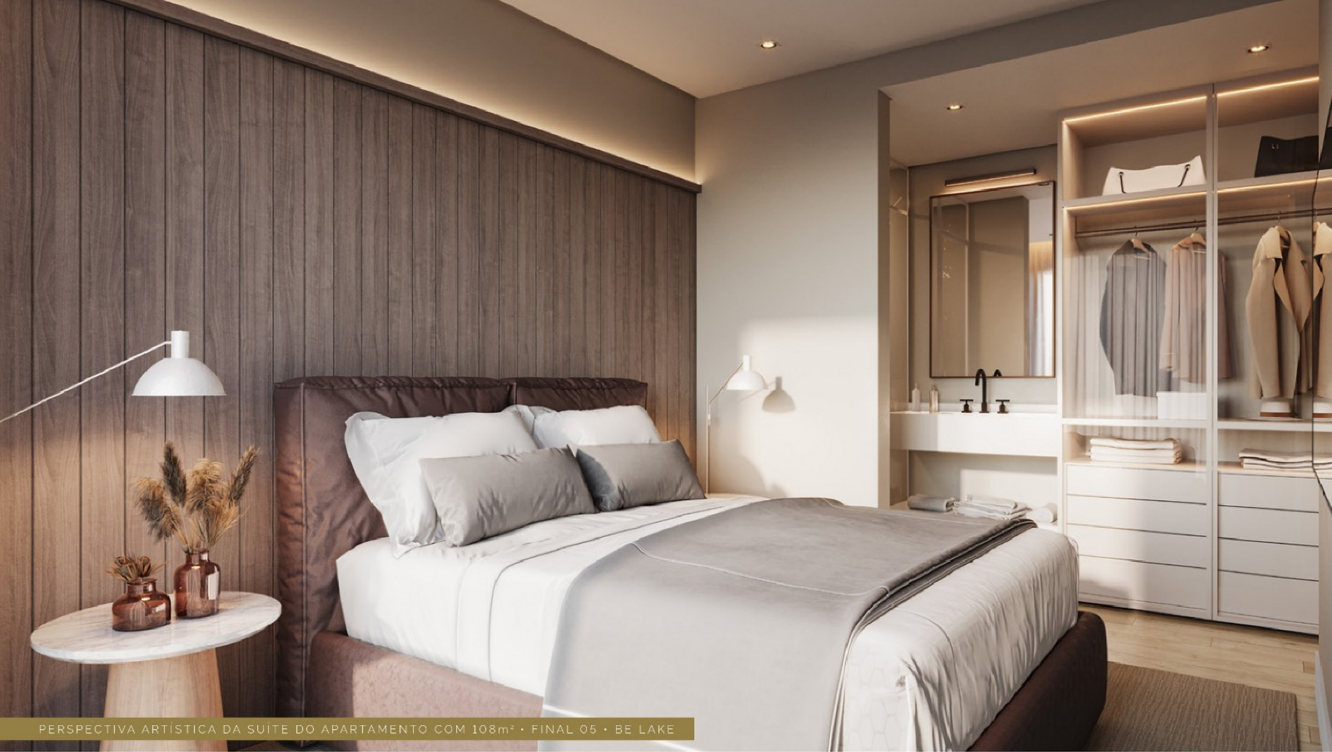
PERSPECTIVA ARTÍSTICA DA SUITE DO APARTAMENTO COM 108m 2 • FINAL 05 • BE LAKE