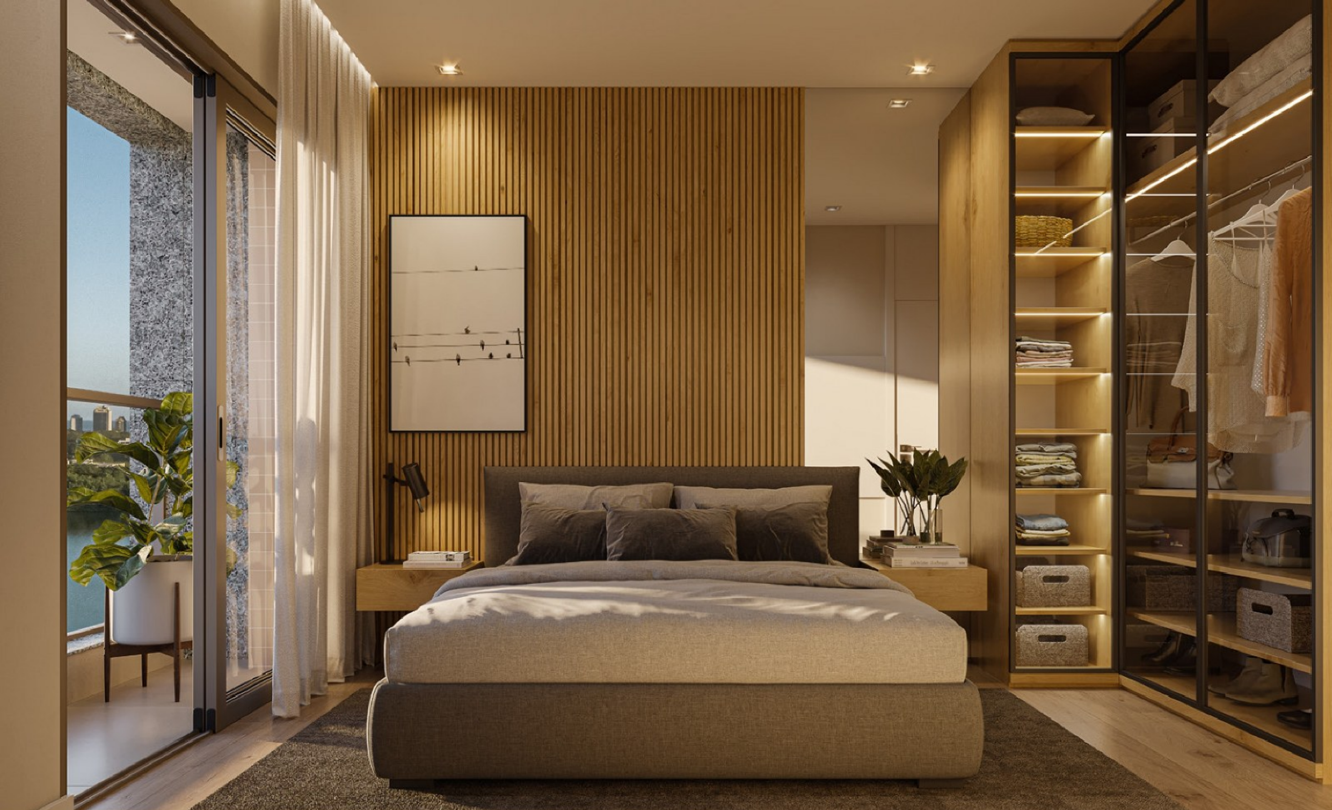
PERSPECTIVA ARTÍSTICADA SUÍTE DO APARTAMENTO COM 96m 2 • FINAL 02 • BE RESERVE